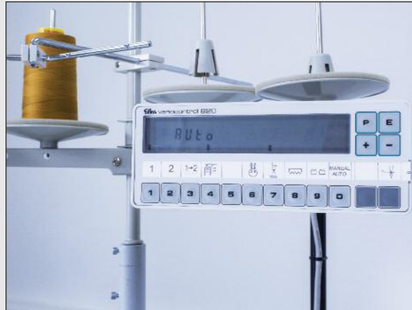
Einfache Bedienung über Bedienfeld