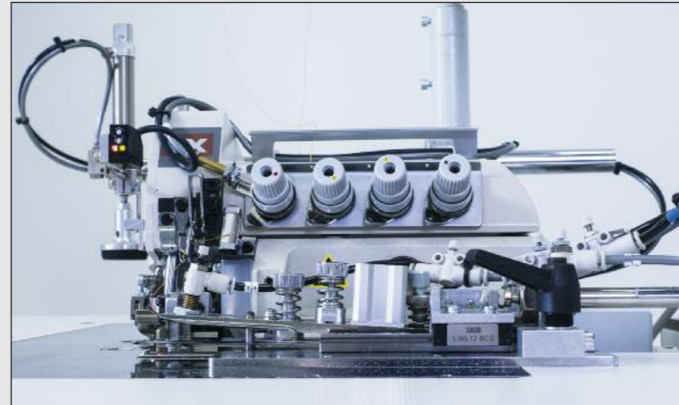
Die exakt justierbare Konturenführung sorgt für konstante Nahtbreiten über die gesamte Nahtlänge